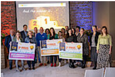
Dank aan alle genomineerden!