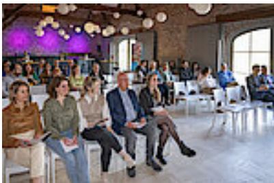
De spannende finale in De Grote Hegge in Thorn

Kijk nog eens alle filmpjes terug via deze link