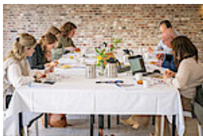
De jury gaat in beraad...